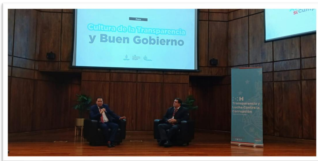
Ilustración 8 Foro de "Cultura de Transparencia y Buen Gobierno"

2. Uso de inteligencia artificial en los procesos de auditoría. Tomando como ejemplo programas que están usando en Brasil y Perú.