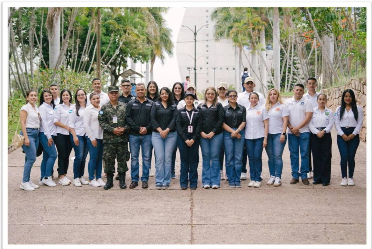
Ilustración 11 La Unidad de Transparencia de la Secretaría de Defensa y Secciones de Transparencia de los Programas y Subprogramas de las Fuerzas Armadas.

En donde cada Fuerza presento su Stand y brindo información a la ciudadanía sobre el presupuesto asignado, actividades y logros obtenidos de las Fuerzas Armadas a la sociedad e invitando a ser partícipe de las demostraciones realizadas en la feria.