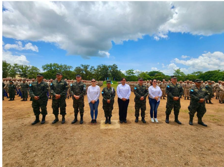
Ilustración 6 Centro de Adiestramiento Militar.