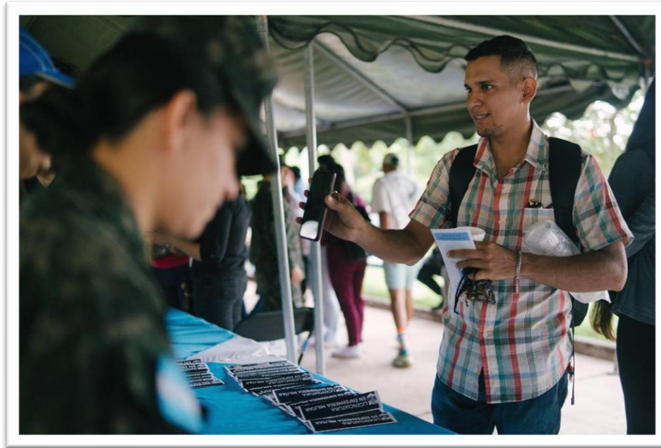
Ilustración 12 Participación Ciudadana.