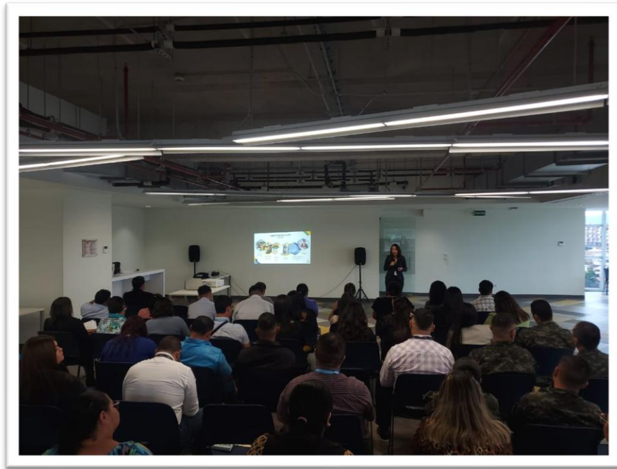
Ilustración 4 Capacitación Personal de SEDENA