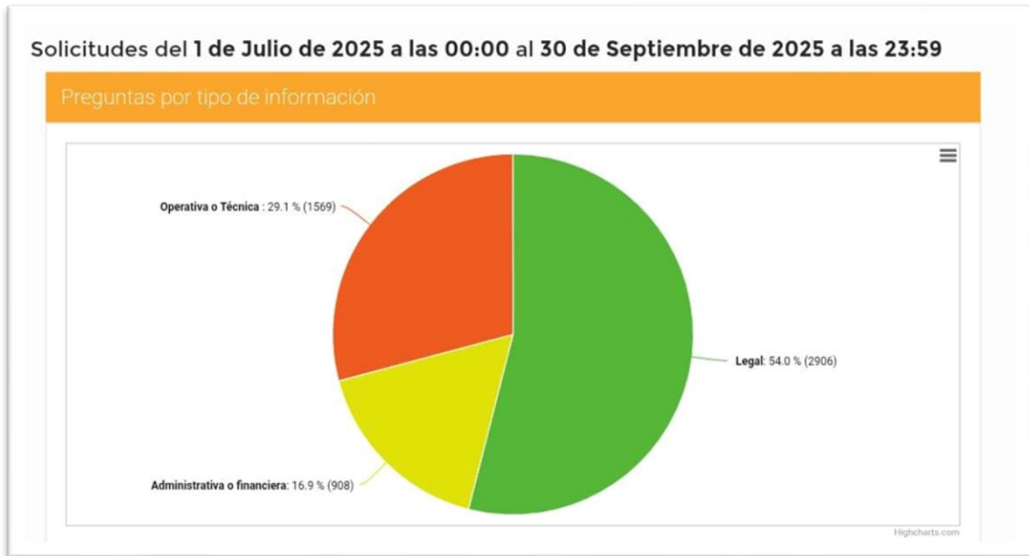
Ilustración 3 Gráfica según tipo de información de las solicitudes

Según estadísticas la solicitud de información que requieren, el 54 % son solicitudes legales, el 29.10% son solicitudes operativas o técnicas y el 16.90% son solicitudes administrativas o financieras.