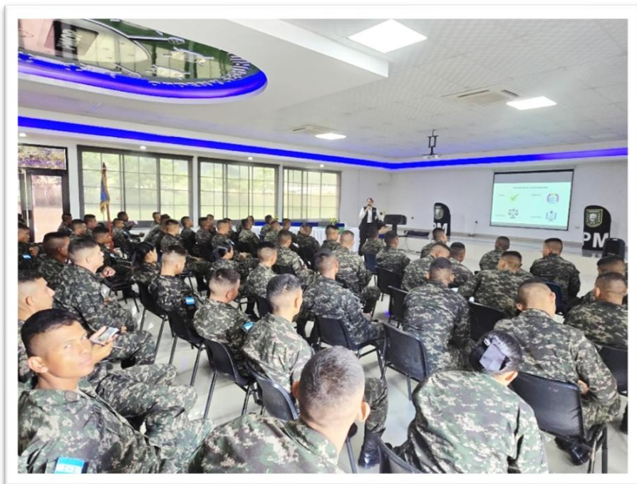
Ilustración 5 Escuela de Capacitación de la Policía Militar y Orden Público.