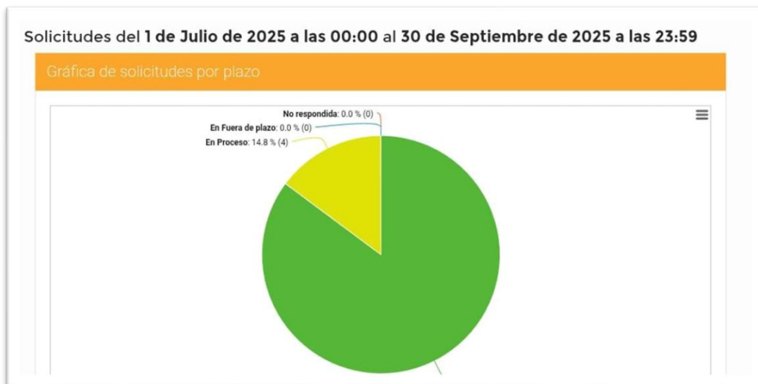
Ilustración 2 Gráfica de respuesta a solicitudes.

Según el periodo del 01 de julio al 30 de septiembre del 2025, se ha respondido el 86.20% de las solicitudes y el 14.80% de las solicitudes están en proceso, debido que el proceso de respuesta va a depender según sea la información que solicitan.