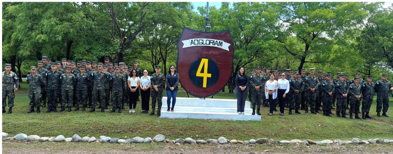
Ilustración 7 Cuarto Batallón de Artillería.