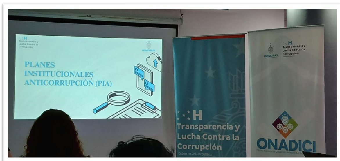
Ilustración 9 Reunión de nuevos lineamientos para la creación de PIA.